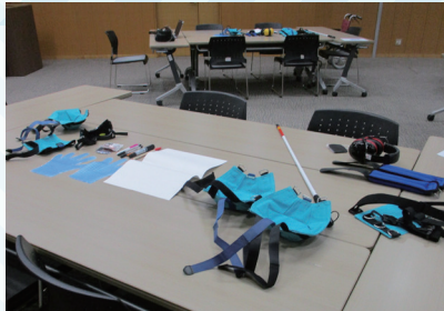
セミナーでは様々な体験セットをご用意