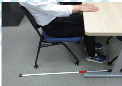
視覚に障害がある方の誘導方法を研修