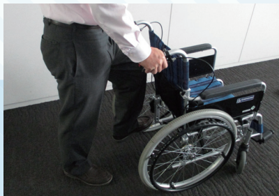
車いすの扱い方を体験