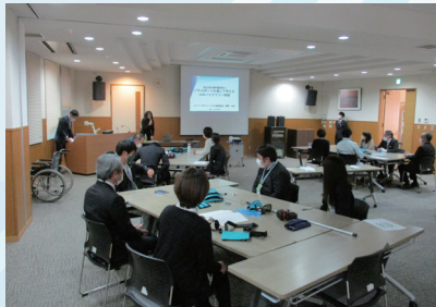
セミナー会場の様子