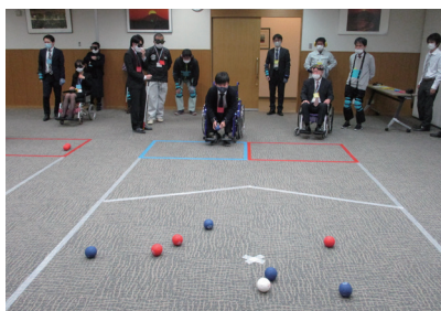
実際にボッチャをプレー