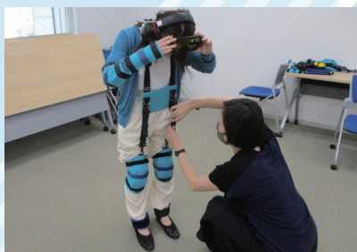
疑似体験装具を着けて高齢者の感覚を体験