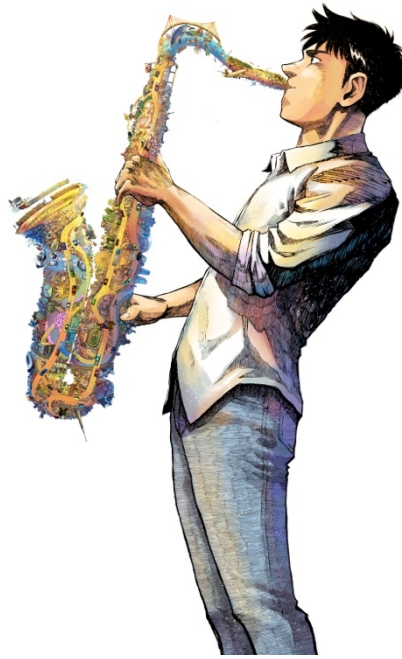
『Tokyo Sound』より ©石塚真一