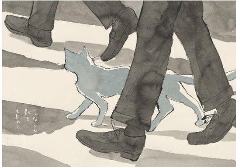
『東京の青猫』より ©松本大洋