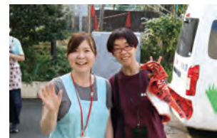
ライフ・ワーク・バランスを充実させながら活躍する職員