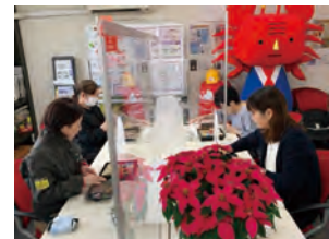
社員同士の親睦を深めるランチ会