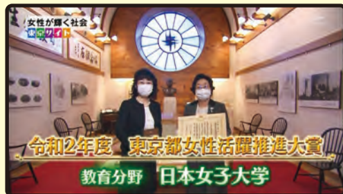
令和2年度 教育分野大賞 学校法人日本女子大学