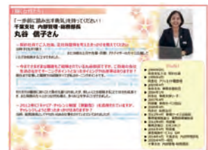
ロールモデル紹介