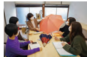
女性による商品企画会議の様子