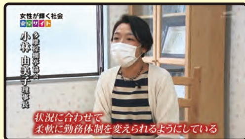
令和2年度 医療・福祉分野大賞 社会福祉法人多摩棕櫚亭協会