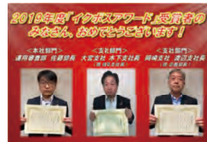
「イクボスアワード」受賞者