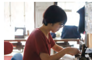
女性職人による傘作り