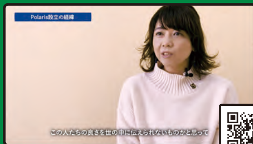
この人たちの良さを世の中に伝えられないものかと思って