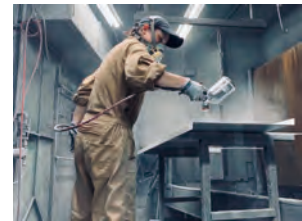
工場で塗装を行う女性社員