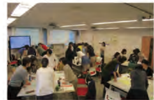
授業風景 (令和元年)