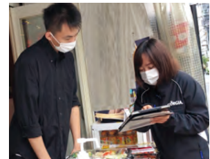
タブレット端末を活用した営業活動