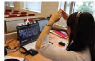
オンライン授業風景 (令和2年)