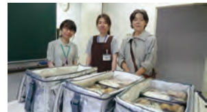
子供食堂の準備の様子