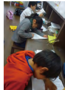
学童学習支援プログラムの様子