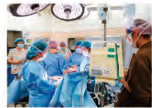
女性チームでの手術風景 (形成外科医・麻酔医・看護師)