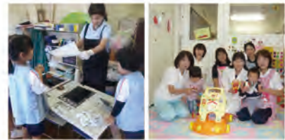
東邦大学保育園・病児保育室ひまわり