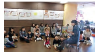
子育て支援プログラムの様子