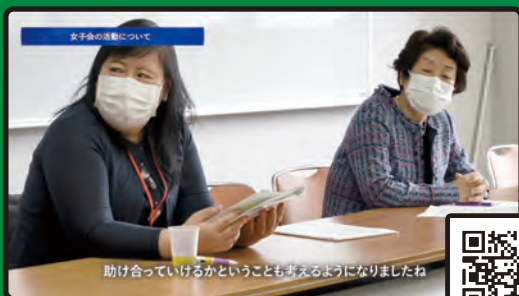
助け合っているかということも考えるようになりましたね