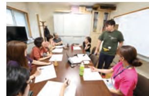
ワークライフ委員会の様子