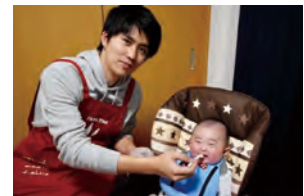
子どもが生まれた男性社員へ「パパエプロン」をプレゼント