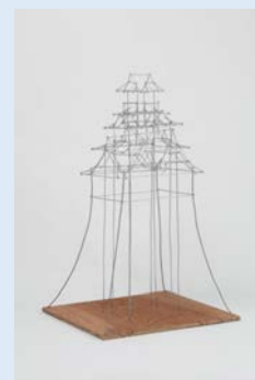
撮影：宮島 径 © AIDA Makoto Courtesy of Mizuma Art Gallery