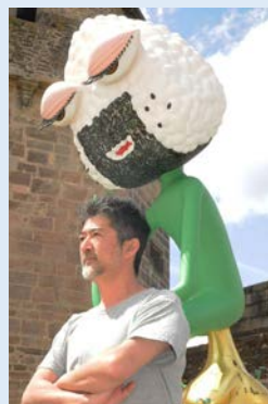
© ADA Makoto Courtesy of Mizuma Art Gallery