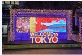
イルミネーション(2019年12月)