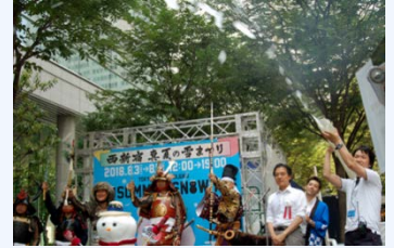
真夏の雪まつり(2018年8月)