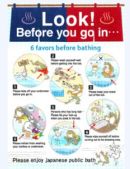
入浴方法案内リーフレット