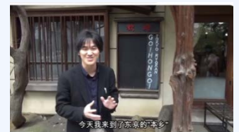
インフルエンサーによる動画配信