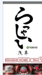
アプリ(らっしやい浅草)