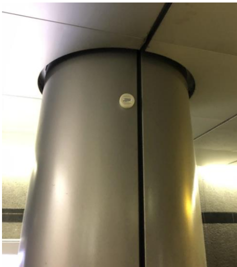
大門駅 BLE ビーコン設置イメージ