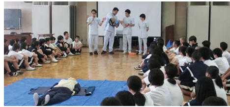
교육, 평생 교육, 지역산업, 건강·복지등의 분야에서 제휴 협력