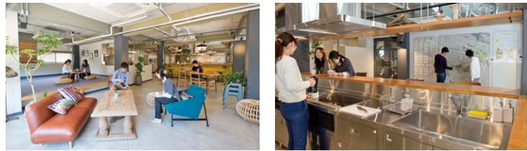
게이오 전철의 낡은 독신자 기숙사를 쉼어형 임대주택으로 개조, 일부를 슈토 대학도쿄의 국제학생숙소로서 활용