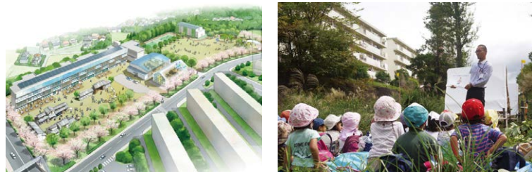
폐교를 개수하여 예술·교육 시설을 설치하고 단지 재생의 거점으로 활용